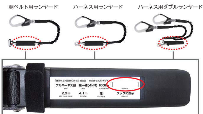
ショックアブソーバー裏面の製造番号を確認してください